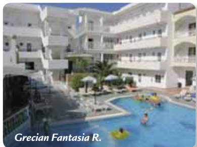
Grecian Fantasia R.

Poloha: Hotel s příjemnou atmosférou se nachází v klidném místě vedle studií Liristis, 400 m od pláže a 200 m od centra letoviska, zastávka autobusu (spojení Rhodos, Lindos) 150 m od hotelu.